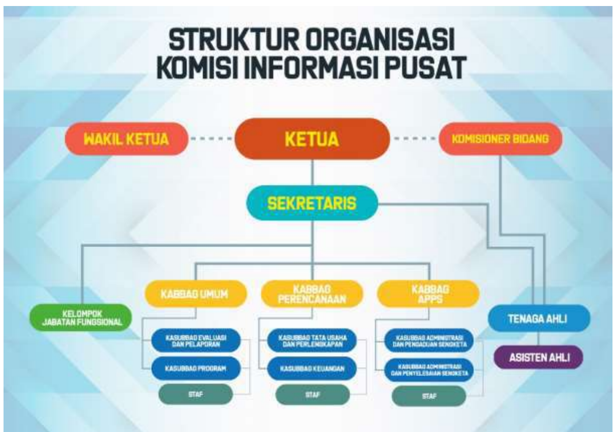
(Gambar 1.1: Struktur Organisasi Sekretariat Komisi Informasi Pusat Pusat)

Adapun struktur organisasi kesekretariatan pada Komisi Informasi Pusat Pusat sebagaimana Gambar (1.1).